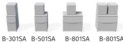
B-301SA B-501SA B-801SA B-801SA

* 本公司保留随时变更规格和设计的权利，恕不另行通知，请以产品铭牌和用户手册为准。